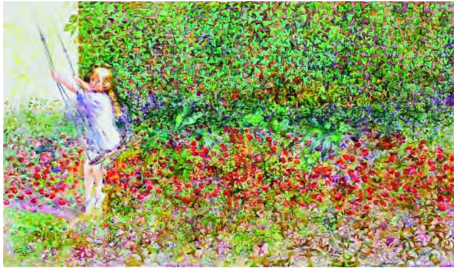
Η γνωστή ζωγράφος επανέρχεται με μια έκθεση-αναφορά στα αυτιστικά μέρη των επιθυμιών της και μιλάει για την «επείγουσα ζωτική ανάγκη» της καλλιτεχνικής έκφρασης