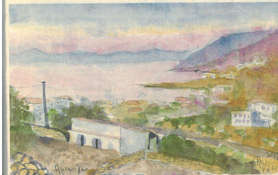
Το Φρυ, επίκεντρο της ζωής στο νησί

Οι Έξι εκκλησιές, οι έξι νεράιδες στην Παναγία και το παλιό λιμάνι του Εμπορείου