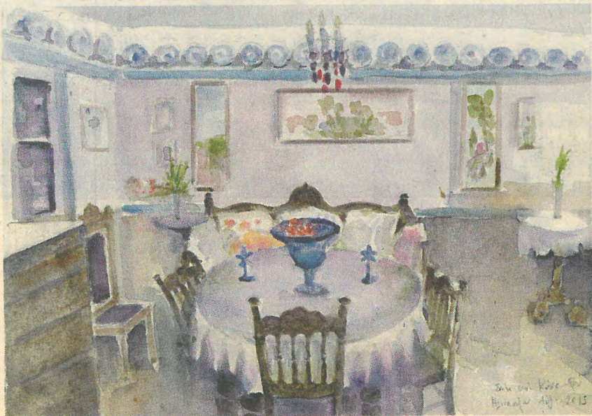
Το σπίτι της Σοφίας στο Φρυ