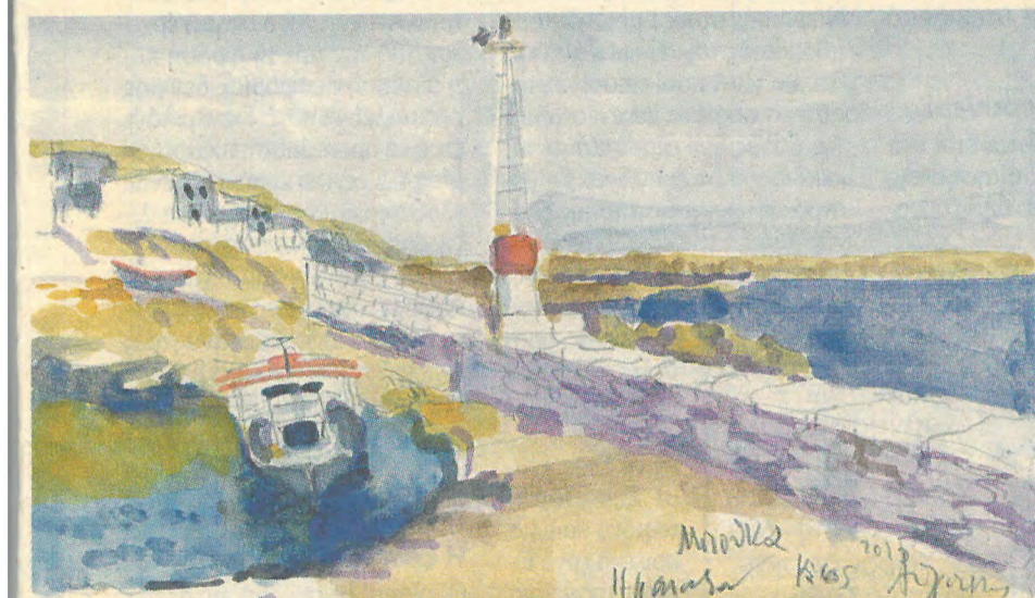
Η Μπούκα, το μικροσκοπικό, παλιό πειρατικό λιμάνι για βάρκες και μικρά τρεχαντήρια