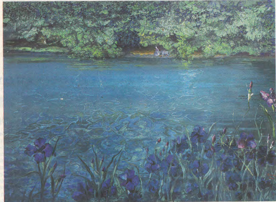
«Ιριδες στα νερά» (2016). Έργο της Ειρήνης Ηλιοπούλου (αίθουσα τέχνης ena contemporary/karlanon galleries ).

Στον κόσμο της Ειρήνης Ηλιοπούλου υπονοούνται τα μυστικά πλάσματα που ζουν στο ημίφως της αλήθειας. Νύμφες, νάρκισσοι,